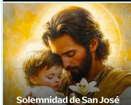
Solemnidad de San José 19 de marzo

Sacerdote cordobés, fue el segundo argentino canonizado, después de San Héctor Valdivielso Sáez (San Benito de Jesús, F.S.C.). Modelo de sacerdocio, "el Cura Brochero tiene la actualidad del Evangelio y es pionero en salir a las periferias geográficas y existenciales para llevar a todos la misericordia de Dios".