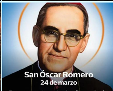
San Óscar Romero 24 de marzo

Obispo de Lima, que siendo laico, de origen español y licenciado en leyes, fue elegido para esta sede y se dirigió a América donde, inflamado en celo apostólico, visitó a pie varias veces la extensa diócesis, catequizó y convirtió a los pueblos nativos, hasta que finalmente en Saña, del Perú, descansó en el Señor (1606).