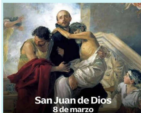
San Juan de Dios 8 de marzo

San Juan de Dios, nacido en Portugal, fue un religioso que se dedicó a asistir a los más necesitados y enfermos en un hospital que él mismo fundó. Tras haber sido militar, se unió a algunos antiguos compañeros y juntos dieron origen a la Orden Hospitalaria de San Juan de Dios. Murió en Granada, España.