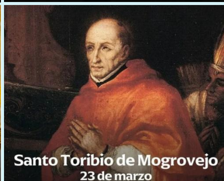
Santo Toribio de Mogrovejo 23 de marzo

Varón justo de la estirpe de David, padre adoptivo de Jesús, el Hijo de Dios. El mismo Cristo quiso ser llamado "hijo de José y le estuvo sujeto como un hijo a su padre". La Iglesia lo venera como a su santo patrono, a quien Dios constituyó como cabeza de la Sagrada Familia.