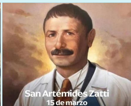
San Artémides Zatti 15 de marzo

San Juan de Dios, nacido en Portugal, fue un religioso que se dedicó a asistir a los más necesitados y enfermos en un hospital que él mismo fundó. Tras haber sido militar, se unió a algunos antiguos compañeros y juntos dieron origen a la Orden Hospitalaria de San Juan de Dios. Murió en Granada, España.