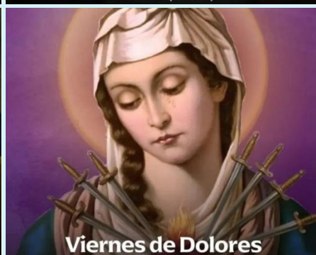
Viernes de Dolores 27 de marzo

En la ciudad de Nazaret, el ángel del Señor anunció a María: "Concebirás y darás a luz un hijo, y se llamará Hijo del Altísimo". María contestó: "He aquí la esclava del Señor; hágase en mí según tu palabra" (Lc 1, 38).