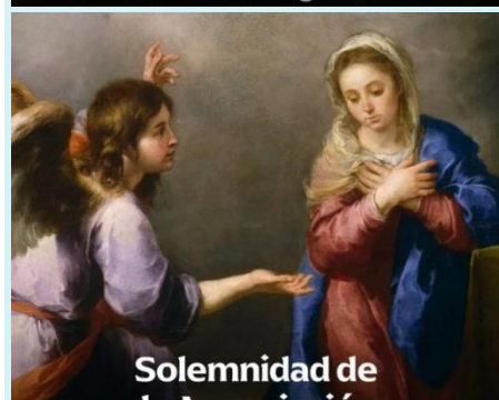
Solemnidad de la Anunciación 25 de marzo

Fue un sacerdote salvadoreño que llegó a ser arzobispo de San Salvador y se convirtió en firme defensor de los derechos humanos y predicador contra toda violencia. Enseñó que la Iglesia debe servir a los más necesitados como "opción preferencial por los pobres". Fue asesinado de un disparo en el corazón mientras celebraba Misa.