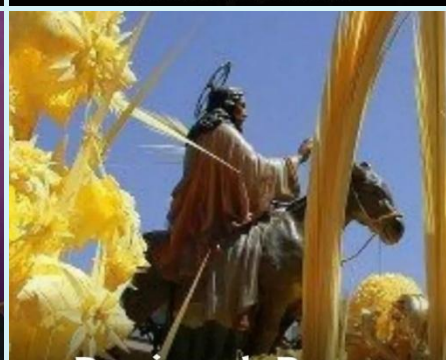
Domingo de Ramos 29 de marzo

En este día se conmemoran los dolores de la Madre de Dios, a siete días del Viernes Santo. Los fieles se dirigen a la Madre de Cristo bajo la advocación de la "Dolorosa" con la intención de acompañarla en los días previos al sacrificio de su Hijo, días de angustiosa espera para Ella.